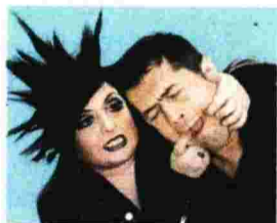
ΠΟΛΥ ΚΑΚΕΣ ΛΕΞΕΙΣ.

► «Στη Σκιά Των Βράχων 2016» 6/6 - 18/9: ΘΕΑΤΡΑ ΒΡΑΧΩΝ: «ΜΕΛΙΝΑ ΜΕΡΚΟΥΡΗ» - «ANNA SYNOΔΙΝΟΥ». Ωρα Έναρξης Παραστά-