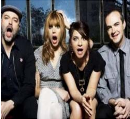
Οι Nouvelle Vague live στο Gazarte