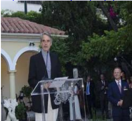
Ο Τζέρεμι Αίρονς τίμησε τη Βασίλισσα Ελισάβετ στη Βρετανική Κατοικία στο Κολωνάκι